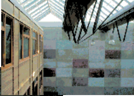
Damit der stark »wolkige« Beton möglichst viel von seiner Entstehung zeigt, wurden schadhafte Stellen sichtbar mit Zementspachtel ausgebessert